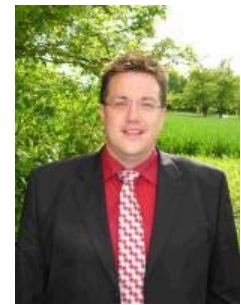
Frank Baitinger Einteiler Aktive SR-Zubehör